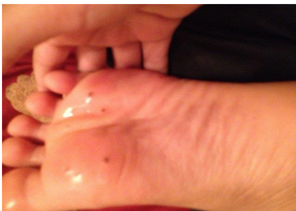
1 Monat nach Behandlungsbeginn